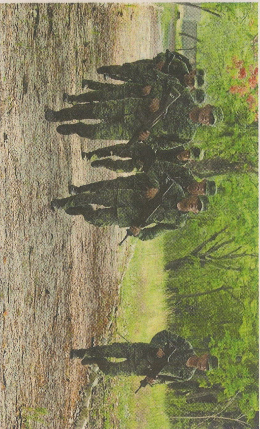
La nueva comercializadora de armas estaría en la Séptima Zona. FOTOGRAFÍA ARCHIVO

○ En un centro comercial, una mujer fue despojada de 10 mil pesos en efectivo y de tarjetas bancarias con las que un cartesista hizo compras por 40 mil pesos, en San Pedro. (Uriel Vélez)