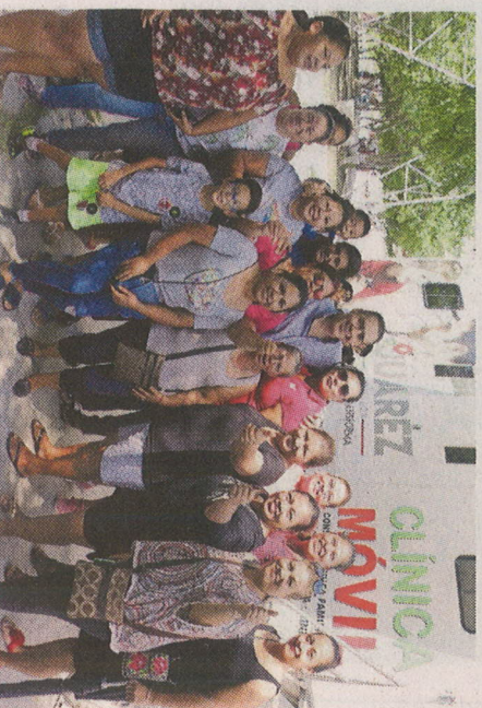
El edil visitó la Clínica Móvil de la Colonia Monte Cristal.

"Continuaremos en este acuerdo que se hizo con los alcaldes en este operativo, que es un operativo de contención, es un operativo para cubrir zonas específicas y estrategias contra el crimen organizado", recalcó. Desde el pasado mes de febrero Cruz, estuvo frente a la coordinación de esta mesa, generando buenos resultados en la zona metropolitana y generando que los