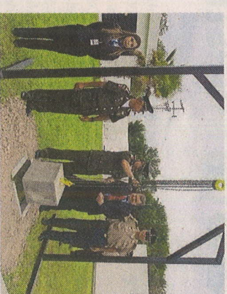
Ayer colocaron la primera piedra en Escobedo.

"En cuanto a su uso para la legítima defensa, buscamos darle legitimidad a los ciudadanos, puede ser polémico y quizás haya gente en contra de que la gente dentro de sus casas esté armada pero yo sí estoy de acuerdo y te puedo decir que la Constitución nos protege, si alguien pretende hacer daño lo pensará dos veces", concluyó Barroso.