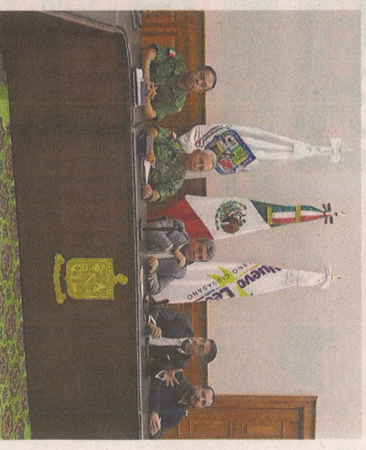
Autoridades Estatales anuncian cambio de mando en la Mesa Estatal para la Construcción de la Paz.

La semana pasada el alcalde reiteró que trabaja en el bienestar del municipio.